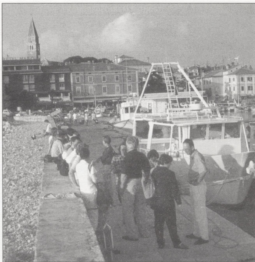
Zbor na pomolu tik pred izplutjem