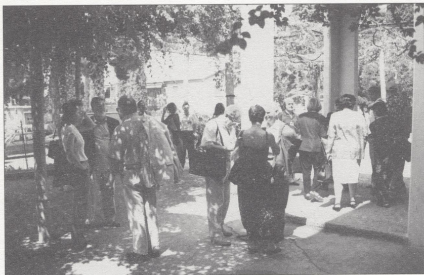
Pavza pred Kulturnim domom v Izoli, prizoriščem konference

Verjetno največji, skoraj zagotovo pa najpomembnejši prostorski plan v severnem Jadranu je bila t. i. Koordinacija regionalnega prostorskega plana zgornjega Jadrana – ime samo izhaja iz poskusa usklajevanja posameznih planov, ki so bili za določena območja že pripravljene. Značilno zanj je, da v svojih analizah in predvidevanjih ni upošteval samo turističnega razvoja mest, ampak tudi širitev industrije v mestih, ter da je preučevanje obalne regi-