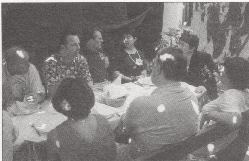
Udeleženci konference po predavanjih – razpravljalci

Strategija VASAB-a temelji na štirih neodvisnih komponentah: