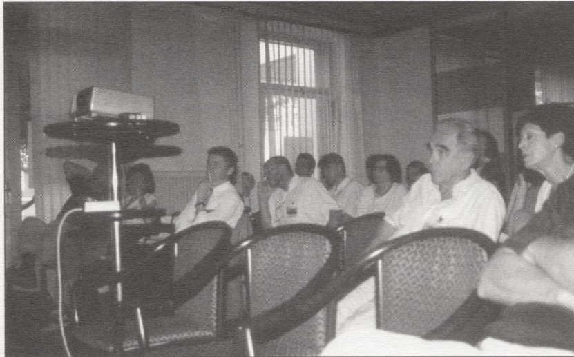
Udeleženci konferenc v Kulturnem domu v Izoli – poslušalci

Pojav Interreg IIC pomeni izziv tudi za projekt VASAB 2010 (Visions and Strategies around the Baltic Sea 2010), ki ga je predstavil Jacek Zaucha. Sodelovanje Belorusije, Danske, Estonije, Finske, Nemčije, Latvije, Litve, Norveške, Poljske, Rusije in Švedske se je pričelo 1992 na srečanju ministrov za okolje in prostor baltskih držav. Najbolj pomemben faktor, ki je stimuliral čezmejno in multilateralno prostorsko planiranje v Baltiku, je bil politični faktor, kar se izraža tudi v dejstvu, da je bila iniciativa za sodelovanje prevzeta z vladne in ne samo regionalne ravni. VASAB 2010 je torej medvladni program sodelovanja in razvoja v regiji Baltiškega morja, v nasprotju z npr. sodelovanjem v Severnem morju (severni Jadran?), kjer so iniciativo prevzele regionalne dežele in kjer so bili ekonomski motivi bistveno močnejši od političnih.