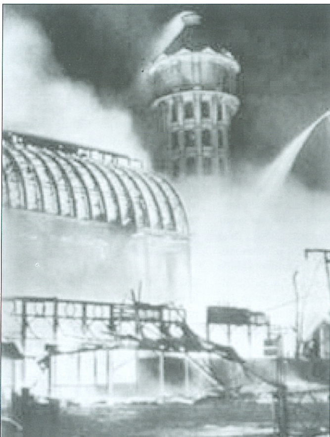
Slika 2: Kristalna palača v Sydenhamu med požarom.

Danes nas na Kristalno palačo spominja le ostanek parka. Nekateri od dinozavrov so edine ohranjene priče preteklosti palače in parka okoli nje. Vendar je Kristalna palača, ogromna struktura iz železa in stekla, stala polnih dvainosemdeset let.