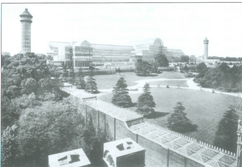
Slika 1: Kristalna palača s parkom v Sydenhamu nekoč.

Kljub visokim stroškom so se odločili za prestavitev zgradbe. Podjetje Fox Henderson & Co , ki je izdelalo železne sestavne dele palače, je odkupilo celotno palačo. Kupilo je tudi več kot 200 juter oziroma več kot 80 hektarov veliko zemljišče ob železniški progi med Londonom in Brightonom, v Sydenhamu . Sir Joseph Paxton je obliko tlorisa delno spremenil in palačo povišal. Vzdolžni del je bil krajši, skupno je imela tri prečne dele in dva dvanajstkotna