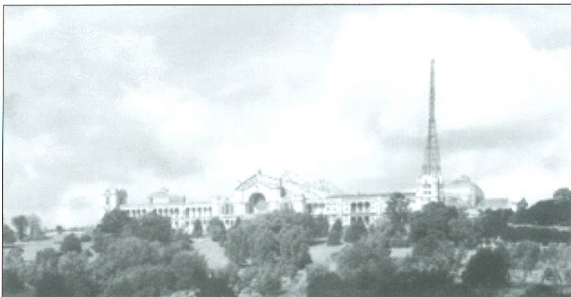
Slika 3: Palača ljudstva na Muswelskem griču nekoč.