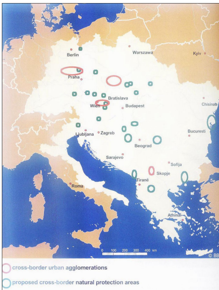
Slika 3. Cone čezmejnega sodelovanja in varovanja

Vsi omenjeni plani, strategije, načela in metodologije se izvajajo prek regionalnega sodelovanja. Vsi kažejo na resno obravnavo in spoštovanje VII. evropskega koridorja. Skupno planiranje čedalje bolj postaja stvarnost in tudi potreba. Tako si vse države Podonavja tlakujejo pot k skupnemu evropskemu planiranju in iščejo svoj prostor na komunikacijskem zemljevidu Evrope. Tudi Srbija se postavlja enako, hkrati pa ureja in ščiti svoj prostor pred nadaljnjim uničenjem in onesnaževanjem. To je edini način za aktiviranje vrednosti Donave in pripadajočega zaledja. Pri tem je treba odmisлити vse administrativne razdelitve in spoštovati lastne posebnosti in posamezne pozitivne izkušnje.