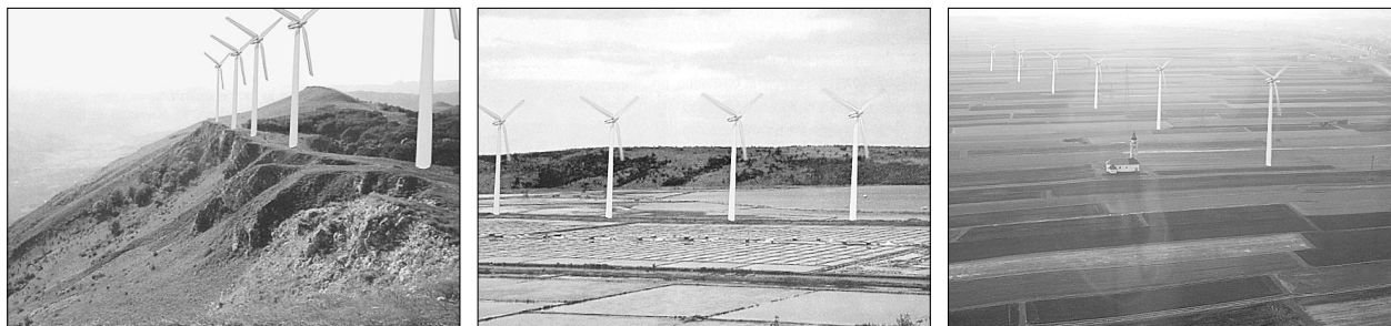
Slika 2: Sprejemljivost VE na različnih krajinskih prizoriščih je primer merila, kjer se ni mogoče opreti na standarde, pa tudi strokovna presoja ni nujno skladna z mnenjem javnosti. Še več, tudi mnenja različnih skupin javnosti se lahko močno razlikujejo. Rezultati ankete, opravljene med študijo o prostorskih potencialih za VE na Primorskem (Brečević in dr., 2001), so pokazali, da je soglasje o nekaterih prizoriščih zelo veliko; bodisi da so VE velika degradacija (levo) bodisi da ne vplivajo bistveno na vizualno kakovost krajine (v sredini). Pri drugih prizoriščih pa so bila nestrinjanja zelo velika (desno). (Opomba: spraševanci so ocenjevali skladnost, zanimivost, naravnost, domačnost in lepoto iste fotografije enkrat z VE drugič pa brez nje).

Eno od ključnih vprašanj, na katera mora odgovoriti načrtovalni postopek, je odločitev o sprejemljivosti predlaganega posega v prostor. Odgovor iščemo na osnovi argumentov za in proti, ki jih je običajno veliko, težava