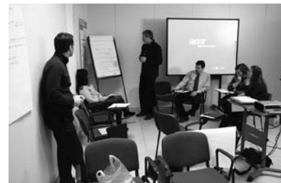
Slika 1: Utrinek z delavnice

še ni sistemsko urejena, se lahko naša podjetja za izdelavo teh odločijo le na podlagi svoje pobude. Mobilnostna načrta, pripravljena v okviru projekta CIVITAS ELAN, bosta tako prva taka primera v Sloveniji.