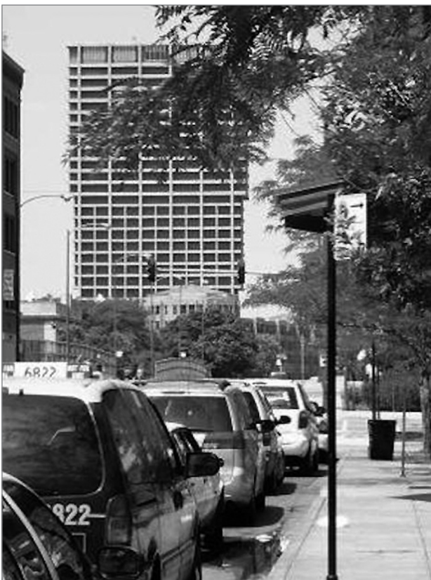
Slika 3: Univerza v Illinoisu v Čikagu: pogled na poslovno stolpnico z ulice Harrison

V tem smislu projekt za kampus v Čikagu univerze v Illinoisu izraža urbanizacijo oblike kampusa in temeljni arhitekturni načeli, ki sta to obliko opredeljevali: ekonomičnost prostora in zmožnost razumevanja kampusa kot dela metropolitanske infrastrukture, bogate z referencami in s pomeni, ki so spadali v čikaško arhitekturno tradicijo in njen najnovejši razvoj. Lahko bi rekli, da je v tistem trenutku kampus uspešno stopil na pot proti mestu. Univerza v Illinoisu s sedežem v mestu Urbana-Champaign, ki je veljalo za njen zgodovinski dom, je zdaj dobila poslopja v Čikagu. Na tej točki je moral projekt doseči jasen dogovor z mestom. Pri pogajanjih je bil najpomembnejši argument urbanega kampusa obljuba, da bo njegova izgradnja izboljšala skupnosti v mestu. V tem pogledu je treba poudariti, da je med nelinearnim procesom izvajanja projekta dialog med lokalnimi ustanovami in ljudmi, ki so preobrazbo najbolj podpirali, potekal prekinjeno oziroma v presledkih (Rosen, 1981). Poleg tega je Daley poskrbel za to, da so državne spodbude lahko sprožile ustrezne programe urbane prenove in obnem