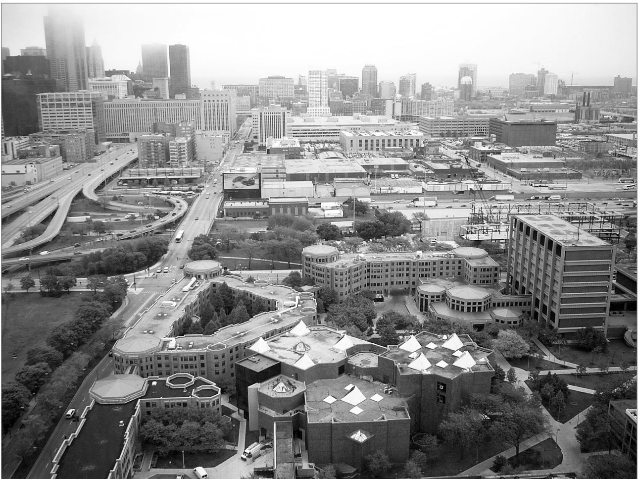
Slika 5: Pogled na univerzo v Illinoisu v Čikagu

Lega kampusu v središču Čikaga 20. stoletja pomaga razumeti Daleyjeve urbanistične in politične namere. Lokacija, ki jo je izbral, omogoča dostop do poslovnega središča in vseh najpomembnejših mestnih storitev, tudi kulturnih (Rosen, 1981). Dejanska posledica izbora te lokacije je, kot je to predvideval