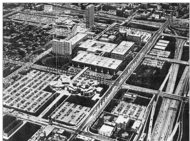
Slika 4: Posnetek univerze v Illinoisu v Čikagu leta 1965

Glavni cilj načrtov, ki so jih izdelali Skidmore, Owing in Merrill, je bil ustvariti pregleden in kompleksen prostor, ki bi se