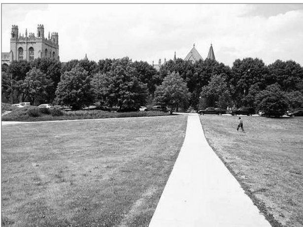
Slika 1: Pogled na univerzo v Čikagu z južne strani

V 20. stoletju je bil Čikago zaradi razlogov, povezanih z geo-