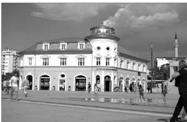
Slika 6: Hotel Union