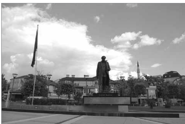
Slika 4: Trg Ibrahima Rugova