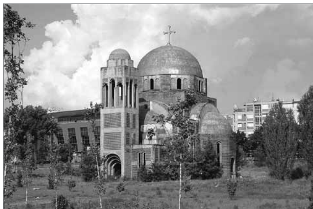
Slika 10: Pravoslavna cerkev