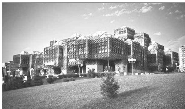
Slika 8: Kosovska narodna knjižnica