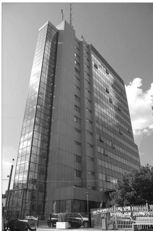
Slika 7: Kosovska vladna palača

V poglavju 2 smo predvideli, da urbanistova percepcija izraža močnejše elemente narodne identitete, če urbanist deluje v fazi izgradnje naroda. Iz preglednice 4 je razvidno, da šest anketirancev v skupini 1 potrjuje to teoretično domnevo, ki jo zagovarjata tudi William Neill (2004) in Mel Ravitz (1988). Po mnenju polovice anketirancev narodna identiteta pomembno vpliva na urbanistovo percepcijo v Prištini. Po drugi strani pa se je četrtnina anketirancev strinjala, da lahko percepcija urbanistov oblikuje narodno identiteto na podlagi javnih prostorov, ki jih ustvarijo.