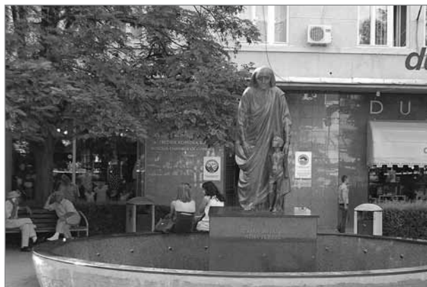
Slika 12: Spomenik Matere Tereze

Hipotezo 3 (Če je urbanist vpleten v intenzivnejše družbene izmenjave, njegova percepcija glede urejanja prostora izraža močnejše čustvene pomene in močnejše socialne konstrukte.) sta zavrnila dve tretjini anketirancev. To se ne ujema z izsledki Brede Mihelič (2008), ki navaja, da obstaja logična povezava med socialnimi konstrukti, ki urejajo odnos med posamezniki in ozemljem ter njihovo obnašanje na mestnih območjih, in percepcijo urbanistov glede urejanja prostora. Družbene silnice, ki delujejo prek prostorskih zakonov, ustvarjajo razlike ter tudi konstante v poselitvenih vzorcih in razporeditvi prostora (Hillier, 2001). Ne strinjamo se z anketiranci, saj zgodovinski, družbenopolitični in gospodarski razvoj povzroča nastanek novih idej, na podlagi katerih se oblikujejo novi javni prostori, kar nam pomaga razumeti posledice širše družbene proizvodnje prostora in socialne konstrukcije tega. Novi pogledi v socialni konstrukciji prostora so posledica konfliktov med različnimi skupinami v Prištini, ki poskušajo opredeliti te mestne prostore in jih pridobiti zase. Za nekatere je Trg Zahira Pajazitija kraj, na katerem potekajo vojaške parade ob dnevu neodvisnosti, za druge pa prostor, na katerem spremljajo filmski festival in na katerem se razkazuje modernizem novih mladih Evropejcev.