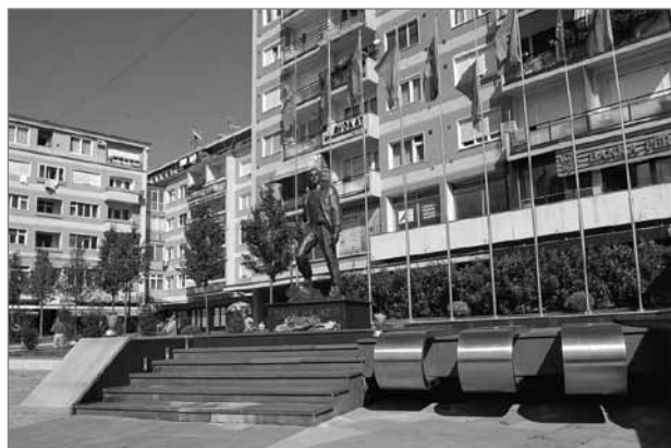
Slika 3: Trg Zahira Pajazitija