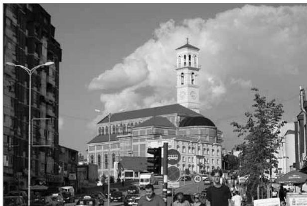
Slika 9: Katoliška katedrala