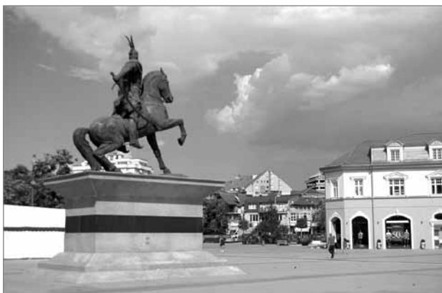
Slika 2: Skenderbegov trg