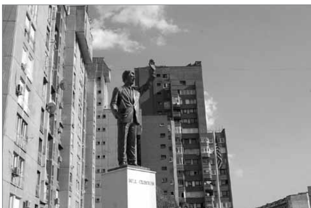
Slika 5: Ulica Billa Clintona