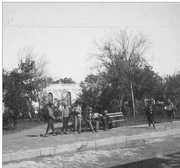
Slika 3: Otroci, ki sami pozirajo pred stavbo odbora za nacionalno zdravje v Monterreyu okrog leta 1900.

Najpogostejše prostočasne dejavnosti v prvih desetletjih 20. stoletja so bili sprehodi po mestnih parkih in trgih ter dnevni izleti v bližnja hribovita območja, kot so Huasteca, San Jeronimo in El Diente. Priljubljeno zbirališče je bil tudi javni bazen ( Alberca Monterrey ). Kdor ni želel plačati (sicer nizke) vstopnine, pa je lahko obiskal jezerce Charco de los Caballos oziroma »konjsko mlako« pred šolo Lazara Garze Ayale, kamor so kočijaži prihajali napajat konje. Tam so se zbirali ljudje