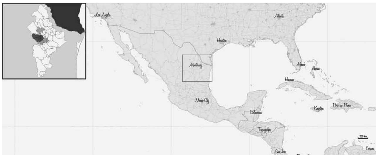
Slika 1: Monterrey, Nuevo Leon, Mehika

Opomba: Robne občine metropolitanskega območja so šrafrirane.