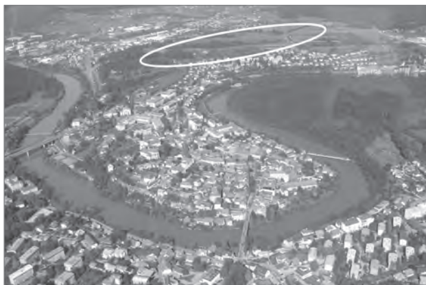
Slika 1: Panoramski pogled na Marof, pod katerim leži staro mestno jedro na okljuku reke Krke (vir: Urbanistični načrt Novo mesto, 2016).

gradišča in grobišča ter delno zaradi velikih dimenzij (okoli 30 ha) in izpostavljene lege tik ob mestnem jedru. Pomembna prvina podobe Marofa je znamenit Kettejev drevored, ki je bil ob izgradnji Ljubljanske ceste pred več kot stoletjem zasajen vzdolž tedaj opuščene mestne vpadnice v dolžini približno 1,5 km in je danes mestno sprehajališče. Edinstvena lega nad mestnim jedrom in obenem v bližini avtocestnega priključka nudi tudi slikovite panoramske poglede na mesto in njegovo široko zaledje.