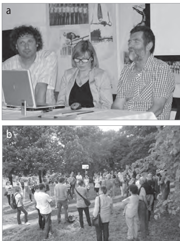
Slika 3: (a) okrogla miza na temo arheološkega parka Marof; (b) urbani sprehod Jane's Walk 2015 – Gremo na Marof

navedeni že zelo natančni predlogi za umestitev programov v parku ter za obseg in oblike predstavitev gomil, bivališč in različnih arheoloških ostalin. Predlagana je bila tudi shema ureditve interpretacijskega centra s trgovino, večnamenskimi prostori, sanitarijami in gostinskim lokalom. V konservatorskem načrtu je posebej poudarjeno, da je Novo mesto eno od redkih arheoloških najdišč, ki se je v urbani aglomeraciji ohranilo tako rekoč nepozidano in prepoznava vzpostavitev