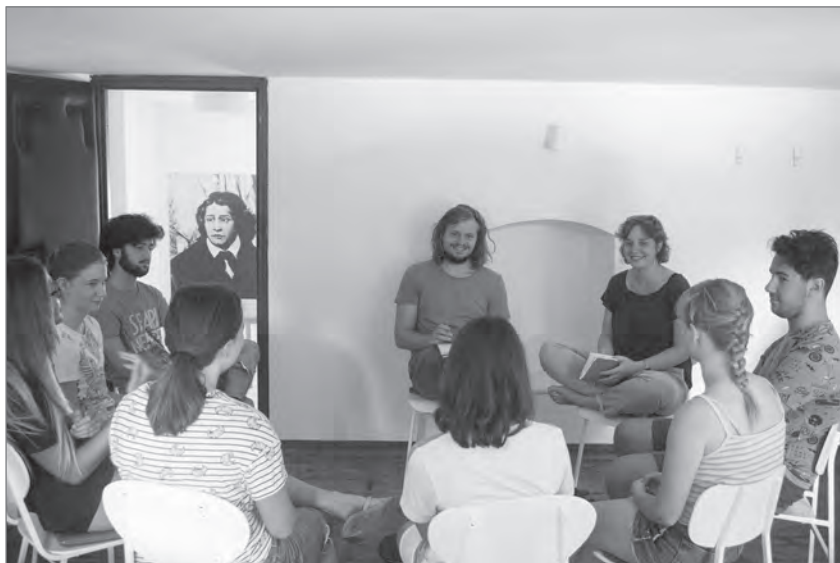
Slika 3: Soba za pisanje: delo z mladimi avgusta 2018