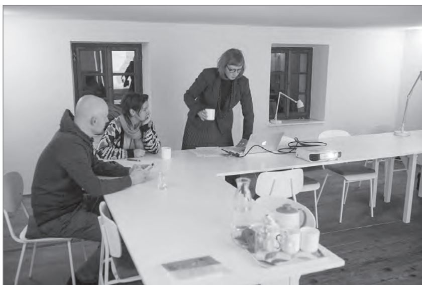
Slika 4: Soba za pisanje: delavnica pisanja potopisov (foto: Jošt Franko)

pine : 1. zaposlene v javni upravi, ki so odgovorni za stavbe kulturne dediščine; 2. upravljavce stavb iz vrst KKI in 3. menedžerje pilotnih projektov. Izboljšane spretnosti omogočajo boljše upravljanje in trajnostno vrednotenje stavb kulturne dediščine. Junija 2018 so v organizaciji RRA LUR in Inštituta za ekonomska raziskovanja (IER) ter v sodelovanju z Zavodom Culturemaker in Mednarodnim grafičnim likovnim centrom potekala usposabljanja za uspešno upravljanje stavb kulturne dediščine. Model upravljanja, ki je del priročnika, partnerji preverjamo v pilotnih pro-