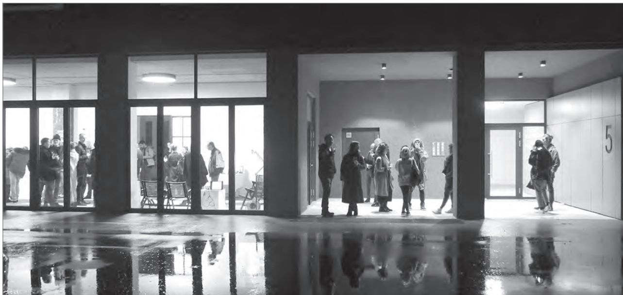
Slika 3: Avtomatik Delovišče je bil prvi delovni prostor skupne rabe v MOK, v katerem so se prepletali druženje, ustvarjanje, izobraževanje in razvoj