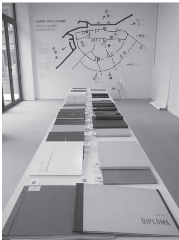
Slika 4: Razstava Koper: Imaginarno

podporo alternativnih in inovativnih prostorskih praks. Društvo je z zasebnim investitorjem sklenilo šestmesečno najemno pogodbo o začasni rabi prostora, ki pa je zaradi epidemije COVID-19 prenehala dva meseca pred dogovorjenim iztekom.