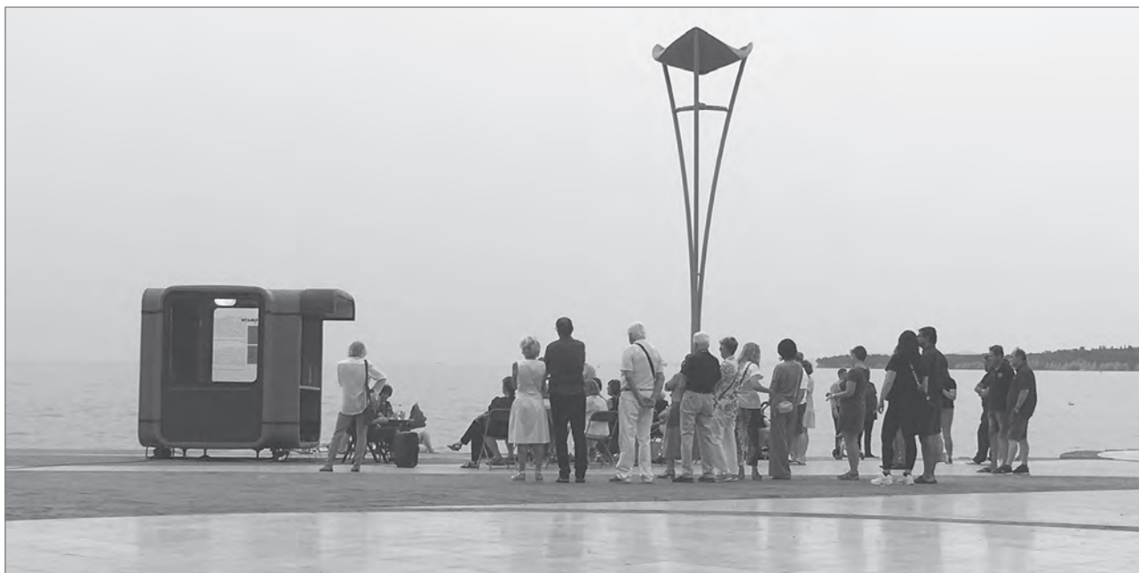
Slika 5: Kiosk K67: koprski vsebinski urbani generator

Marca 2020 je Delovišče zaradi epidemije COVID-19 prenehalo izvajati program v živo. Junija istega leta se je iztekla pogodba o začasni rabi v Tomosovi stolpnici. Čeprav se je investitor zavedal doprinosa, ki ga je Delovišče omogočilo na lokaciji, in si je želel, da bi pritličje objekta še naprej delovalo kot javni prostor, je prevladal ekonomski vidik njegovega upravljanja. Prostor je res najprej ponudil v najem z možnostjo odkupa kolektivu Delovišče, vendar temu ni uspelo zbrati potrebnih finančnih sredstev, zato so morali prostor zapustiti. Kolektiv se je tako obrnil na MOK in podal prošnjo za pridobitev evidence praznih občinskih prostorov v upanju, da bi lahko v enem izmed njih nadaljeval svoje aktivnosti. Izkazalo se je, da MOK te evidence ne vodi in da začasne rabe kot prostorske prakse še ni uporabil, čeprav je bila ta od leta 2018 že opredeljena v Zakonu o urejanju prostora (ZUreP-3, Ur. l. RS, št. 199/2021). Zato je kolektiv Delovišče sam pripravil popis praznih občinskih prostorov, primernih za vnos začasne rabe, ter zanje pripravil možne scenarije reaktivacije in jih predstavil Oddelku za nepremičnine MOK, ki pa je dal jasno vedeti, da jih brezplačna ali začasna raba ne zanima, saj prednost dajejo oddajanju nepremičnin po tržni ceni.