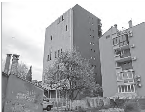
Slika 2: Pogled na prenovljeno Tomosovo stolpnico z dvorišča palače Tutto ex Gavardo

Po končani prenovi Tomosove stolpnice (slika 2) je Kulturno umetniško društvo C3, ki je že od leta 2017 iskalo in evidentiralo območja, primerna za začasno rabo, dalo pobudo za vzpostavitev začasne rabe v njenem pritličju, ki jo je zasebni investitor sprejel. Cilj društva je bil ustvariti skupnostni avtonomni ustvarjalni prostor, ki bi omogočal povezovanje različnih akterjev (od neprofitnih organizacij in ustvarjalnih posameznikov do lokalnih prebivalcev) z različnimi usmeritvami in znanji (Cotič, 2023). Zasebni investitor je začasno rabo v Tomosovi stolpnici videl kot priložnost, ki bi spodbudila promocijo in oživitev dolgo let zapostavljenega in degradiranega stanovanjskega območja Belveder. Tako je vsaj za kratek čas predal prostor v javno rabo in s tem lokalni skupnosti in drugim akterjem omogočil soodločanje v procesih prostorskega načrtovanja. Poleg tega je s to odločitvijo spodbudil prožno produkcijo prostora ter omogočil urbano eksperimentiranje s