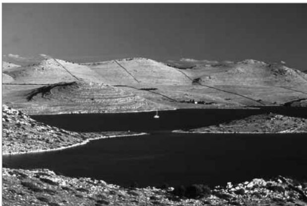
Slika 1: Sredozemska krajina – otoki Kornatov/naslovna slika študije Outstanding Landscapes in the Mediterranean

Prav zato se je s študijo Outstanding Landscapes in the Mediterranean želelo podati pogled v prostorsko problematiko, v opredelitev prepoznavnih in posebej vrednih območij, imenovanih izjemne krajine. Poseben cilj študije je bil svetovati vsem tistim, ki želijo udeležiti koncept izjemnih krajin kot posebnih varovanih krajin na načrtovalskem in upravljalškem področju, in sicer tako za odgovorne strokovnjake na državni, regionalni in lokalni ravni, v okviru nevladnih organizacij in povsod drugje, še posebej za tiste, ki sprejemajo odločitve, v politiki in vseh drugih oblikovanih skupinah od lokalne do mednarodne ravni.