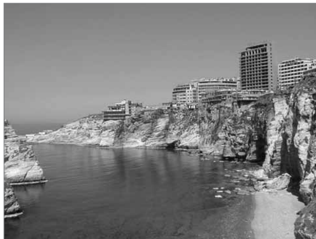
Slika 5: Turistično obalno območje, Bejrut

V zadnjih desetletjih je zelo prisotna modernizacija kmetijstva