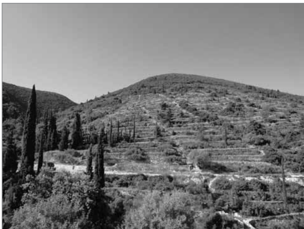
Slika 6: Teraso v zaraščanju – Račišče, Korčula

z uvajanjem novih tehnologij in kmetijskih praks, kot so plantažni nasadi in podobno. Z intenziviranjem kmetijske pridelave se precej zmanjšujeta biotska (vrste, habitati) in krajinska pestrost, pri čemer se spreminja tipična podoba Sredozemlja, in sicer s posegi, kot so osuševanje mokrišč, izguba sipin, spremembe in regulacije vodnih strug, reliefna izravnava obdelovalnih površin in podobni ukrepi. Obenem se posledično pojavlja erozija tal in ponekod tudi že dezertifikacija – proces širjenja oziroma oblikovanja območij puščav, kar je lahko posledica podnebnih sprememb, neustrezne rabe tal ali določenih kompleksnih součinkovanj teh dejavnikov. Drugje, v strmejših predelih se množično opušča obdelovanje kmetijskih površin in so te izpostavljene zaraščanju, s čimer prihaja do temeljne preobrazbe kulturnih krajin (slika 6). Izgubljajo se tradicionalni krajinski vzorci rabe prostora, spreminjajo se krajinske strukture in teksture drobne členjenosti, poljske delitve, uporabe naravnih elementov (kamniti zidovi in podobno.).