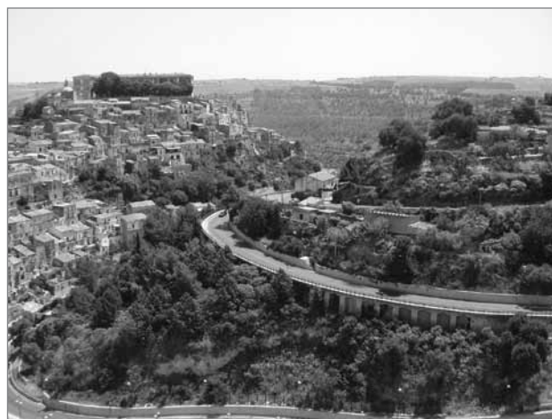
Slika 3: Urbana krajina – Ibla, Sicilija