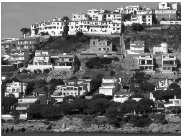
Slika 4: Novo stanovanjsko naselje na obali, Cala Montgo, Španija

Hitro rastoča koncentracija prebivalstva, predvsem v zadnjih dvajsetih letih, nekontroliran razmah turizma in s tem povečanje območij za prostočasne dejavnosti, rekreacijo in šport v obalnem pasu povzročajo najizrazitejšo degradacijo obalnih mediteranskih krajin. To je najbolj prisotno v državah južnega Sredozemlja, čeprav je trend več ali manj opazen povsod. Vse to je povezano z zemljiškimi špekulacijami in s črnograditeljstvom, tako stanovanjska in turistična gradnja posega v najbolj kakovostna obalna območja, kar trajno negativno vpliva na obalni pas in obalne krajine. Urbanizacija obale je že tako močna, da je dosegla stanje nasičenosti oziroma hiperrazvoja, za katerega je značilna visoka koncentracija prebivalstva, degradacija okolja in s tem zmanjšanje kakovosti bivanja. Največji problem v nenehnem naraščanju številu prebivalstva v Sredozemlju je širjenje poselitve in gradnje infrastrukture v ozek obalni pas