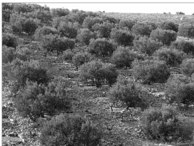
Slika 2: Plantaža oljk (foto: Marko Prem)

Tradicionalni pridelovalni krajinski vzorec sredozemskega obalnega pasu oblikujejo predvsem rastje s prepletom naravnih rastlinskih prvin, okrasnega rastlinja in kmetijskih kultur ter strnjena manjša naselja. Oblike pridelovalnega prostora označujejo številne manjše pravokotno zasnovane površine, ki se nizajo v pobočjih kot terasaste površine. Širino teras določa strmina pobočja. Za kmetijska zemljišča je značilna mešana kultura kot splošni sredozemski pridelovalni vzorec, v katerem se mešajo pridelava zelenjadnic, zelišč, poljedelskih kultur, vinske trte, oljk in sadnega drevja. Mešano pridelavo omogoča velika osvetljenost čez vse leto in višje temperature sredozemskega podnebja. Tradicionalni krajinski vzorec »mešane kulture« izpodriva sodobna ureditev kmetijskih pridelovalnih zemljišč, ki opušča nekdanje terase na strmih pobočjih in ureja večje strnjene pridelovalne površine v bolj ravninskih delih. Osnovni vzorec pa ohranjajo sredozemske okrasne rastline in