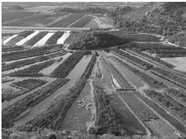
Slika 9: Kulturna krajina delte reke Neretve

pri prostorskem načrtovanju zagotoviti strokovne podlage ter ustrezne pravne in tudi materialne razmere za vzpostavitev sistema izjemnih krajin.